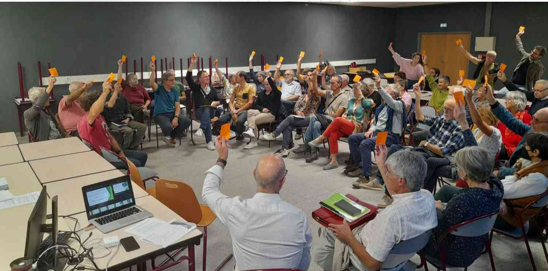
Assemblée Générale des citoyens du Blaisois (BlaisWatt / B.Watt-41 SAS - 2022)

Le secret d'une bonne dynamique citoyenne ? => Partager des valeurs communes !