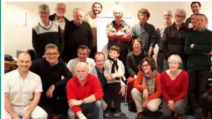
Un collectif de personnes concernées par le devenir de la planète.

Le plus gros collectif citoyen de la région lors de sa première réunion (BlaisWatt, mars 2019)