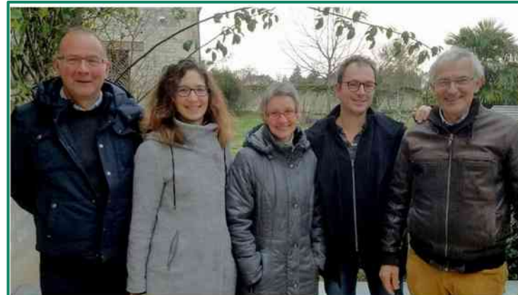
Basée à Huismes, l'association est menée par ce comité de pilotage de cinq personnes. Et compte vingt adhérents.

Le plus gros collectif citoyen de la région lors de sa première réunion (BlaisWatt, mars 2019)