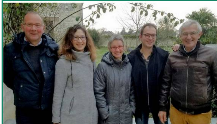
Basée à Huismes, l'association est menée par ce comité de pilotage de cinq personnes. Et compte vingt adhérents.

Première réunion du collectif annoncé à la presse (BlaisWatt, mars 2019)