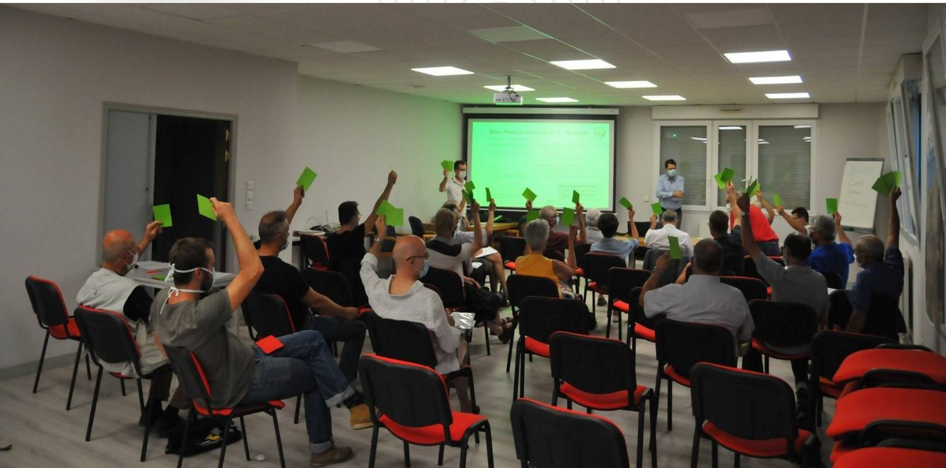
Unanimité lors d'un vote au sein du collectif Energies Vendômoises / PICVERT SAS - 2019