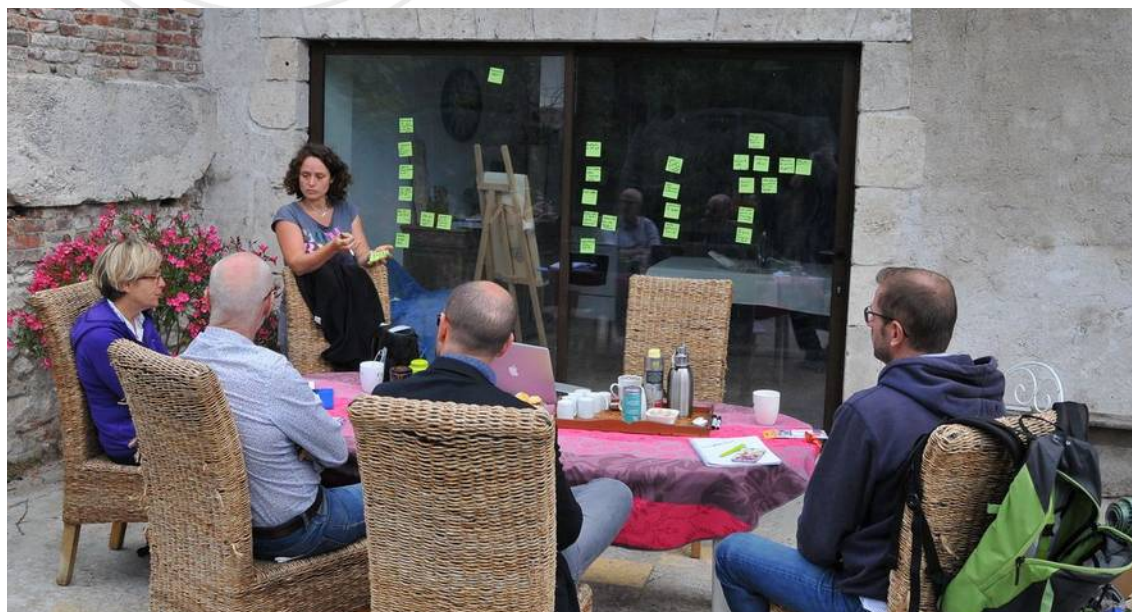
Collectif « Un coup de Meung pour la planète » travaillant sur sa charte de valeurs (Meung-sur-Loire, 45).

La charte de valeurs donne un cap pour le groupe afin de graver dans le marbre sa raison d'être et ses déclinaisons. Elle pourra constituer une boussole pour adopter une posture lors des réunions, représenter le groupe à l'extérieur et effectuer des choix structurants. Cette charte pourra aussi constituer un motif d'adhésion pour les futurs membres du groupe. Grâce à cette charte de valeurs explicites, les nouveaux pourront s'identifier au groupe même s'ils n'ont pas participé à la définition initiale de sa raison d'être et ses valeurs partagées.