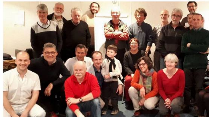
Un collectif de personnes concernées par le devenir de la planète.