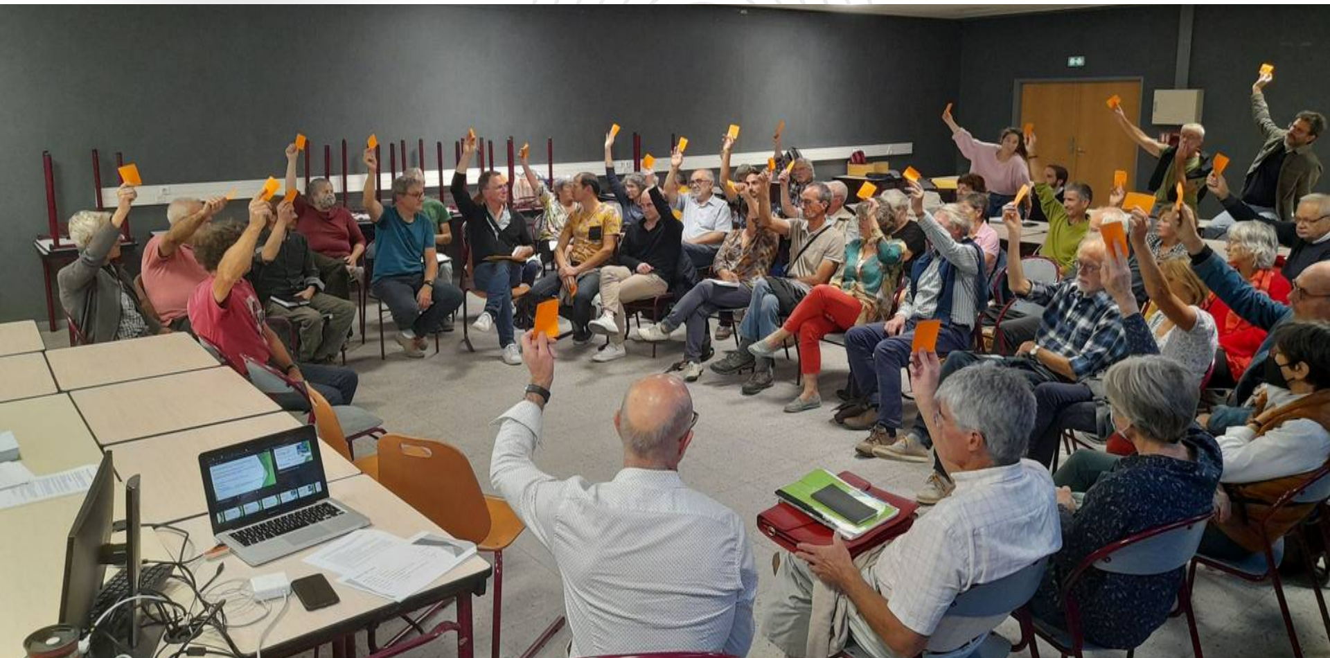
Assemblée Générale des citoyens du Blaisois (BlaisWatt / B.Watt-41 SAS - 2022)