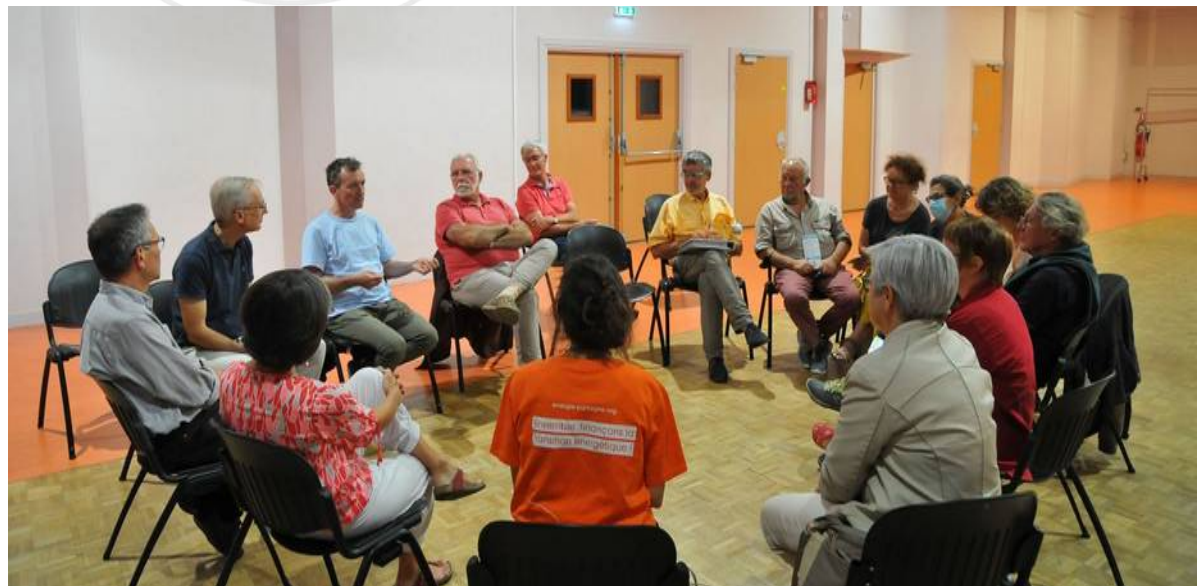
Collectif « Blais'Watt » lors d'une réunion de réflexion (Vineuil, 41).

La charte de valeurs donne un cap pour le groupe afin de graver dans le marbre sa raison d'être et ses déclinaisons. Elle pourra constituer une boussole pour adopter une posture lors des réunions, représenter le groupe à l'extérieur et effectuer des choix structurants. Cette charte pourra aussi constituer un motif d'adhésion pour les futurs membres du groupe. Grâce à cette charte de valeurs explicites, les nouveaux pourront s'identifier au groupe même s'ils n'ont pas participé à la définition initiale de sa raison d'être et ses valeurs partagées.